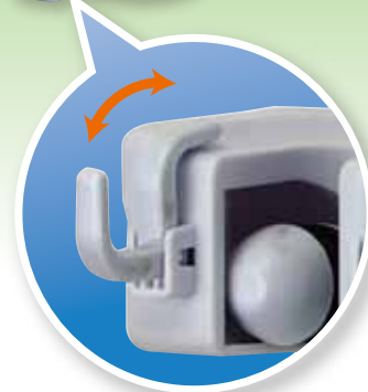
フック折りたたみ型